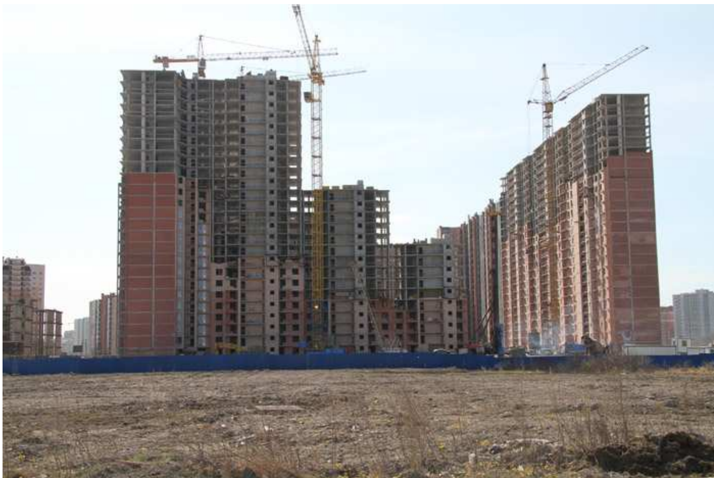
Вид со стороны Областной улицы 29-26, 31, 17-15