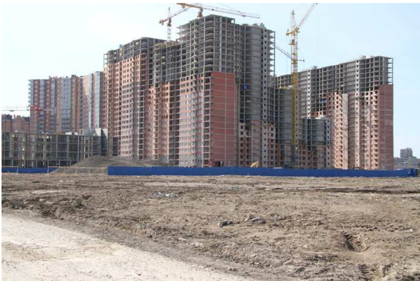
Вид с Областной улицы на секции 35-26, 15-17 со двора