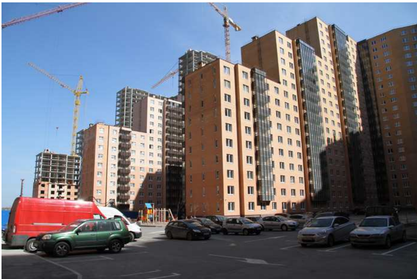
Вид со двора, секции 1-4, 31-34, 26