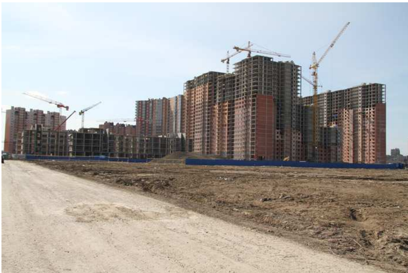
Вид с Областной улицы на секции 35-26, 15-17 со двора