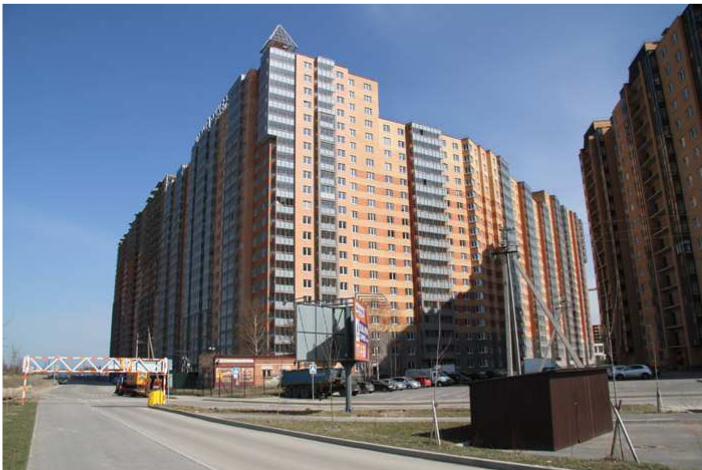
Вид с Областной улицы на секции (слева направо) 17-7