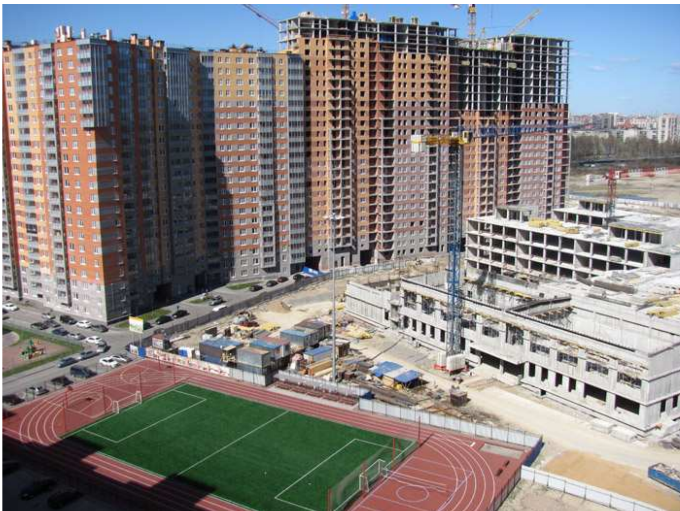
Вид со двора, секции 7, 6, 5, 4, 35, 34, 30, 29