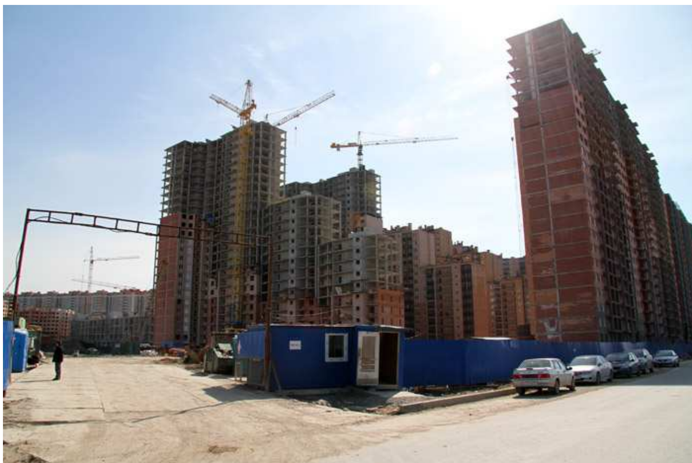
Вид со стороны Областной улицы 29-26, 31, 17-15